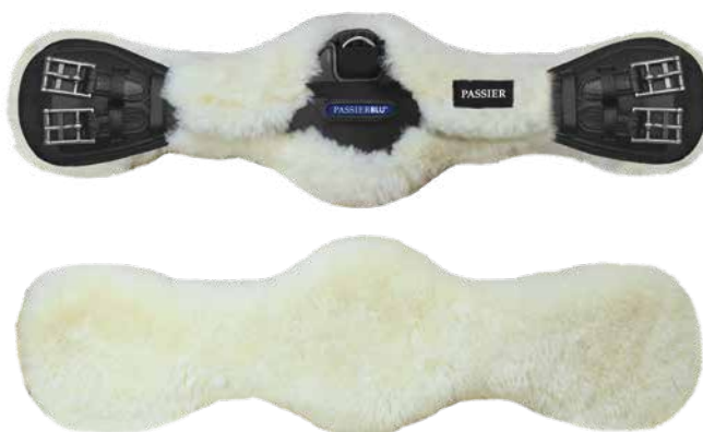
Der Lammfellbezug: das weiche Extra für den PASSIERBLU Wave Ledersattelgurt (Bild: jpg)